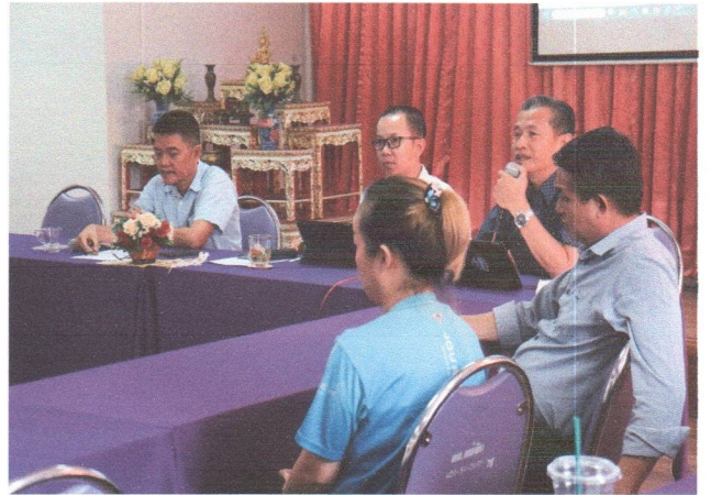
โครงการอบรมให้ความรู้เกี่ยวกับพัสดุ